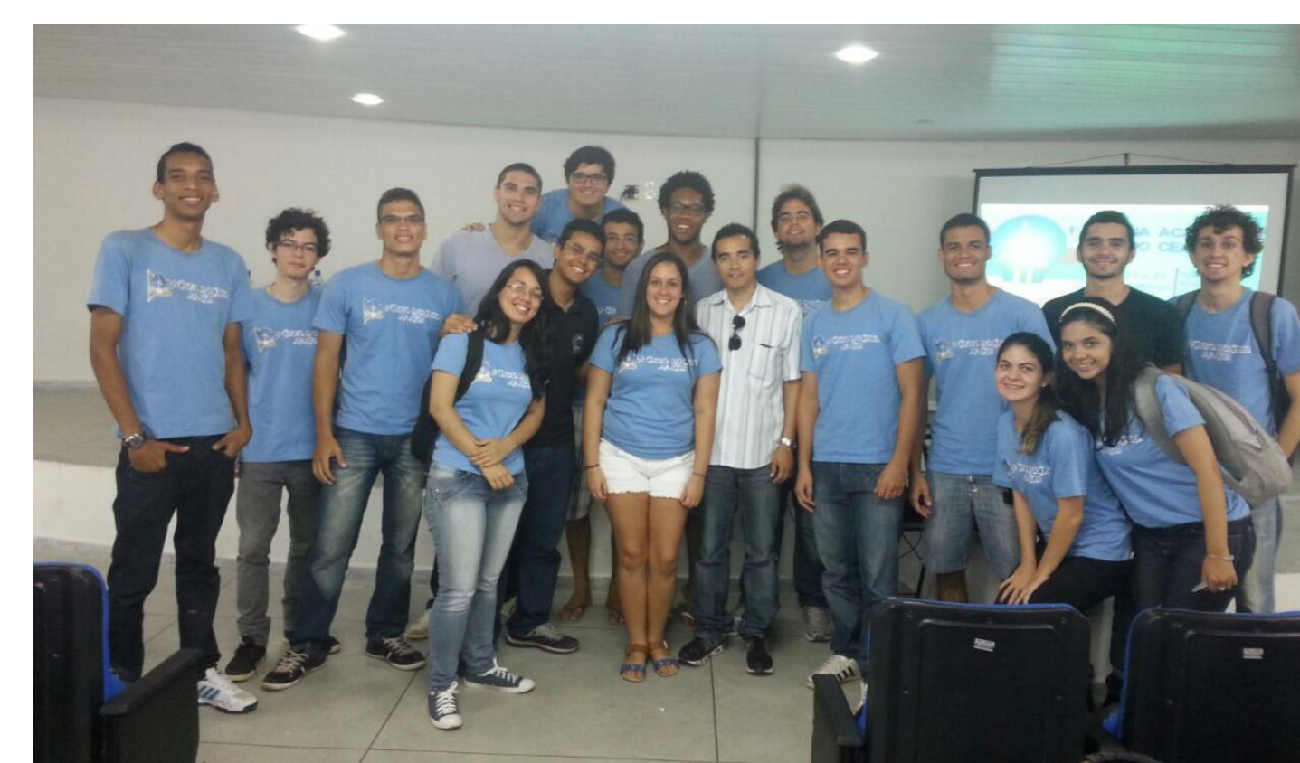
Figura 8. Equipe de organização da Semana Acadêmica do CEAR.