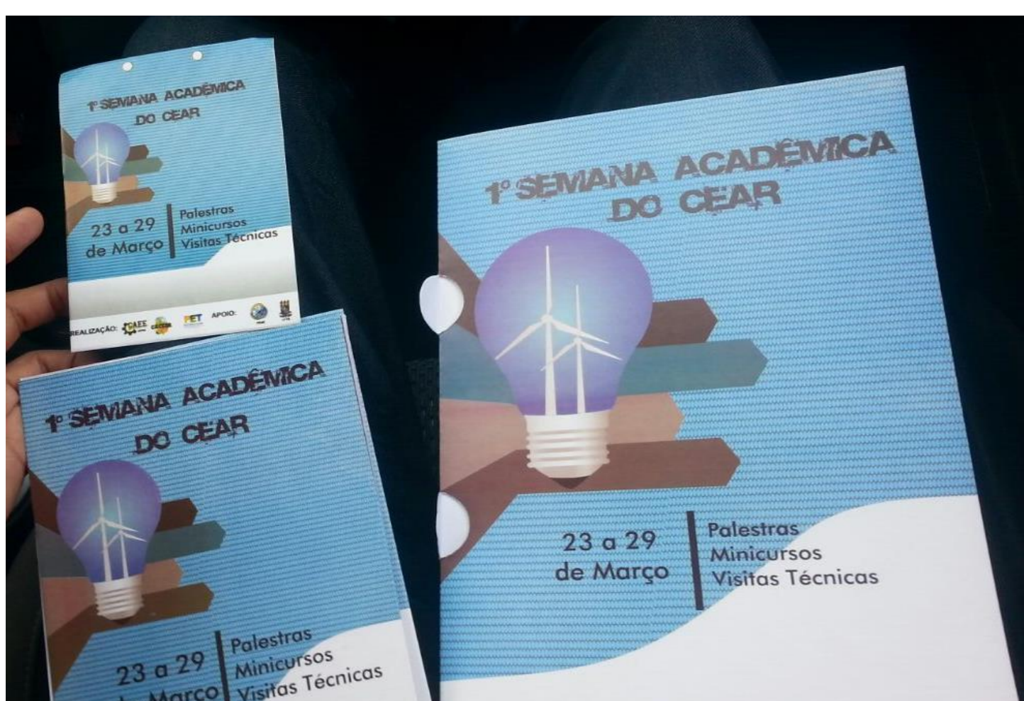
Figura 2. Material distribuído aos inscitos.