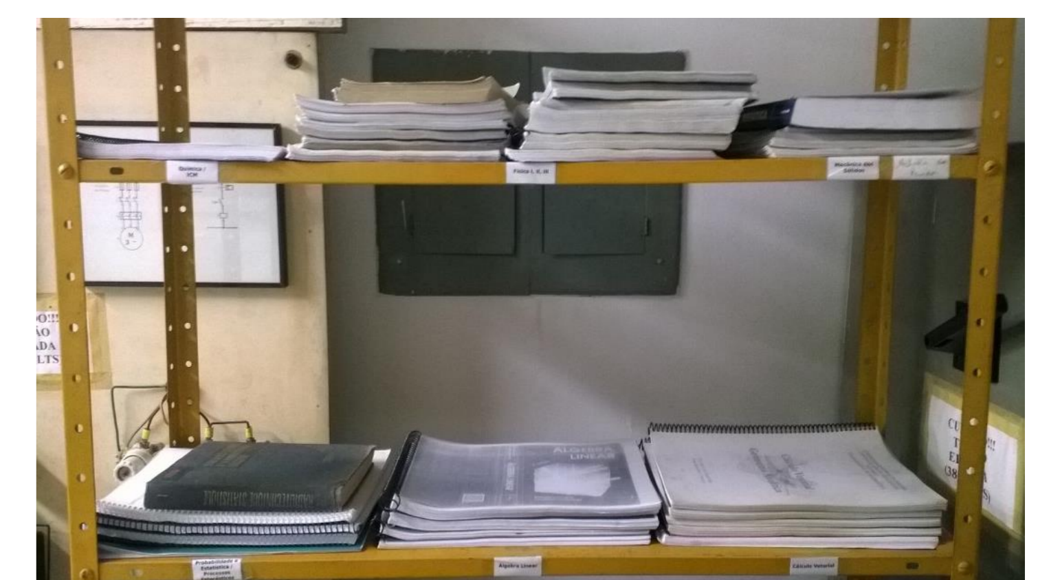
Figura 9. Parte do acervo da PEToteca.