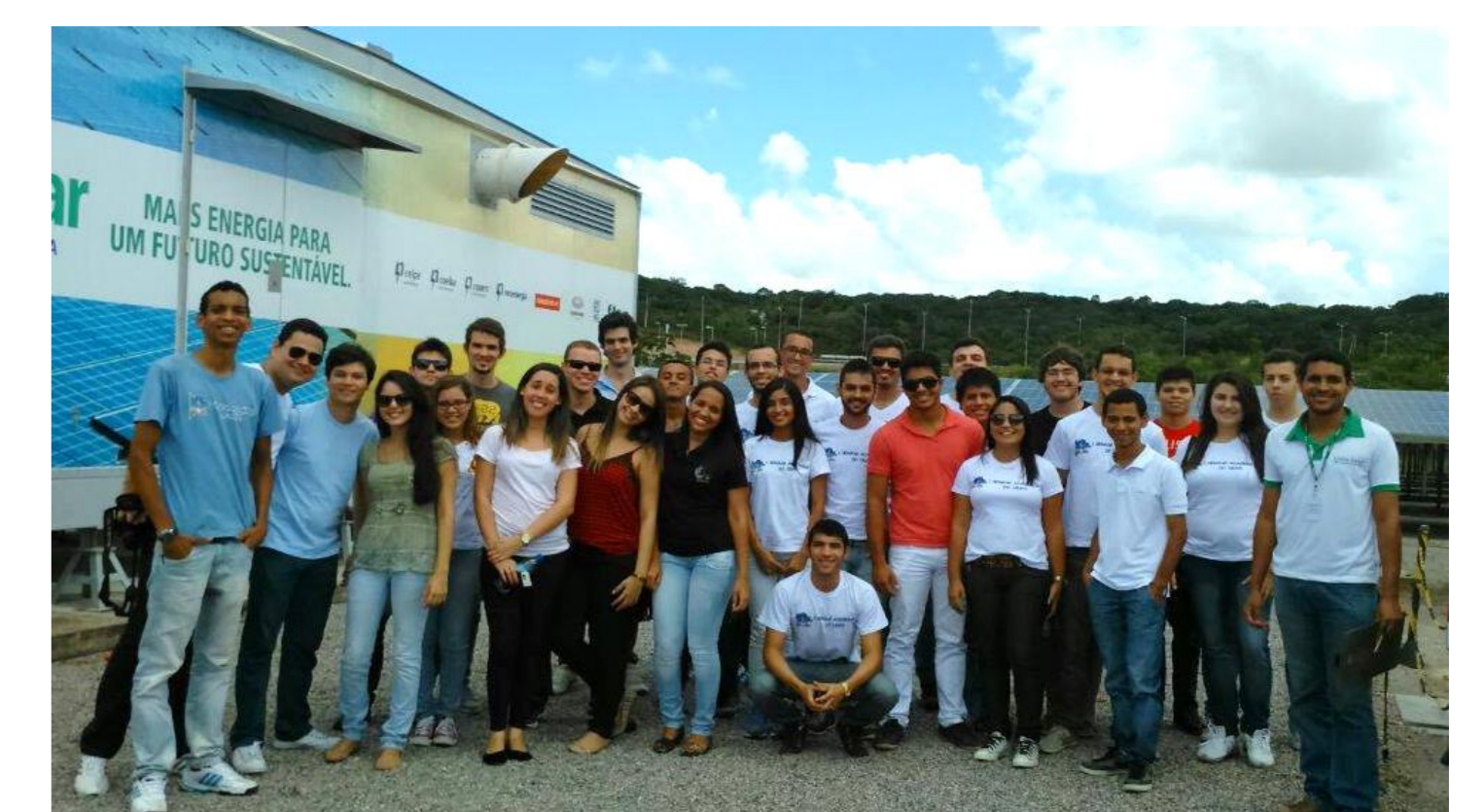
Figura 7. Visita técnica – Usina Solar São Lourenço da Mata – Pernambuco.