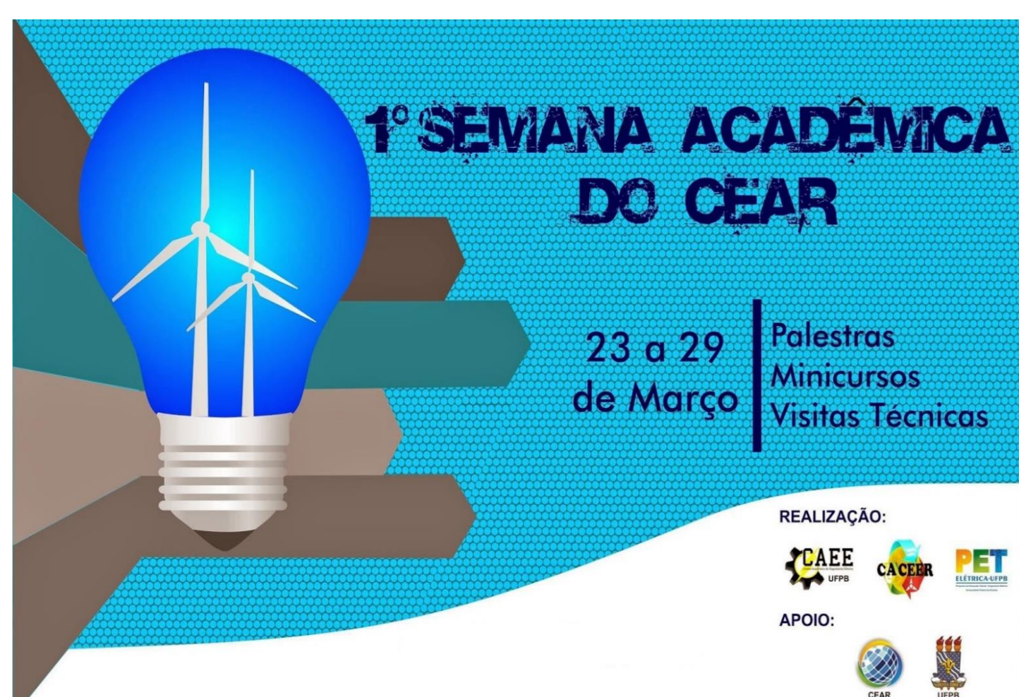
Figura 1. Logo da 1ª Semana Acadêmica do CEAR.

O grupo PET – Elétrica UFPB busca o desenvolvimento de atividades em prol da comunidade acadêmica do Centro de Energias Alternativas e Renováveis (CEAR), na Universidade Federal da Paraíba (UFPB). Dentre as atividades desenvolvidas pelo grupo PET nesse âmbito, pode-se destacar a Semana Acadêmica e a PEToteca. A semana acadêmica teve sua primeira edição no primeiro semestre de 2015, uma parceria entre PET – Elétrica UFPB, o Centro Acadêmico (CA) de Engenharia Elétrica (CAEE), o CA de Engenharia de Energias Renováveis (CACEER) e a Assessoria de Extensão. Alguns exemplos dos materiais produzidos nestas atividades podem ser vistos nas Figuras 1 a 3.