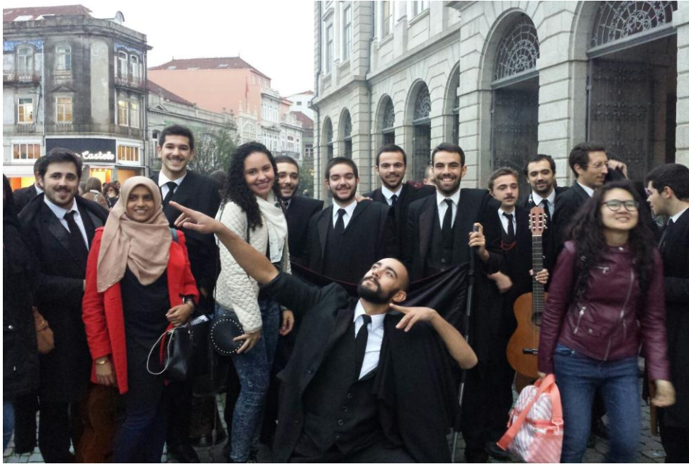
Foto 02: Ainda no contexto da celebração do Magusto, integração com a Tuna da Universidade do Porto, importante tradição entre os universitários portugueses e disseminação da cultura do Fado.