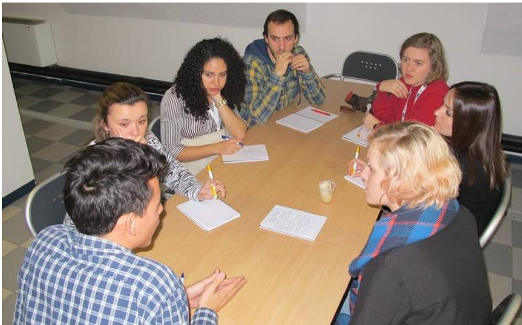
Foto 05: Um dos momentos mais construtivos do intercâmbio. Participação junto ao UNICAH workshop, realizado na Università degli studi di Pavia , na Itália, como estudante representante da Universidade do Porto (da rede de universidades do grupo Santander). O UNICAH workshop foi realizado durante uma semana, onde ocorreram atividades, discussões, palestras, grupos de trabalho, etc., voltados para o desenvolvimento internacional, cooperação e ação humanitária com foco na África. Foi extremamente gratificante representar o Brasil e a Nutrição em uma discussão tão importante, uma vez que eu era a única estudante brasileira e da área da Nutrição selecionada para participar. Na foto, discussão com estudantes franceses, espanhóis, italianos e suecos.