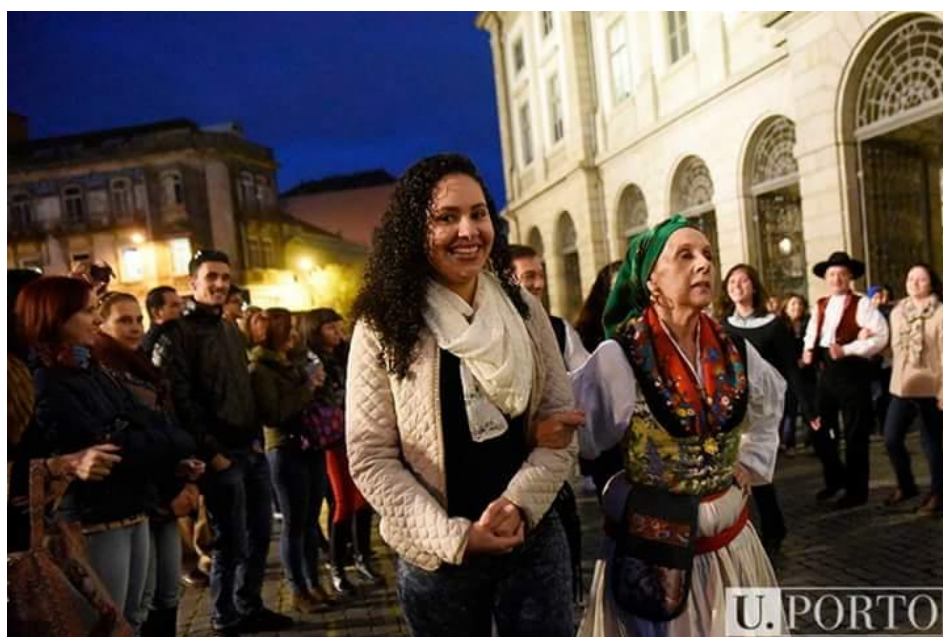
Foto 01: Celebração do “Magusto” Internacional, festa popular portuguesa em comemoração ao dia de São Martinho, marcado por danças tradicionais, muito fado e deliciosas castanhas portuguesas assadas. Embora o Magusto seja um evento celebrado por todo o país, o Magusto Internacional foi um evento especial organizado pelo Gabinete de Relações Internacionais da Universidade do Porto como forma de integração e aproximação da cultura portuguesa pelos estudantes internacionais.

Sinta-se à vontade para inserir algumas fotos que possam ilustrar o período do intercâmbio e incluir comentários/descrições sobre elas.