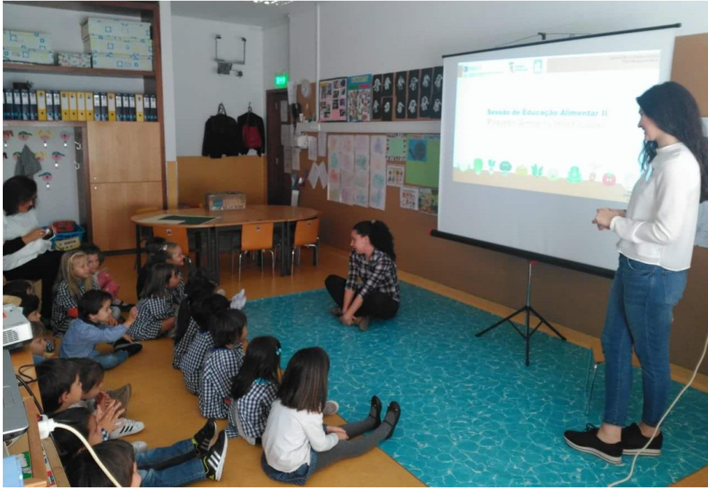
Foto 04: Durante todo o semestre participei de um Projeto junto à disciplina “Nutrição Comunitária”, chamado “Projeto Amigos Hortícolas”, no qual semanalmente deveríamos desenvolver atividades de Educação Alimentar com crianças do pré-escolar, como forma de promover hábitos alimentares saudáveis, sobretudo, o maior consumo de vegetais. Na foto, o registro de um dos momentos desses encontros.